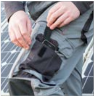
VERSTÄRKT KNEE ZIP-OUT HANDYTASCHE