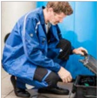
VERSTÄRKUNGEN KNIE MIT KNIETASCHEN