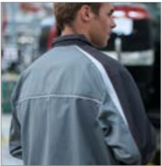
RÜCKEN REFLEXSTREIFEN UND KONTRASTKEIL