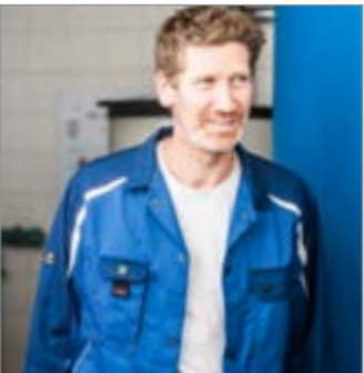
HOHE HALTBARKEIT GUMMIERTE DRUCKKNÖPFE