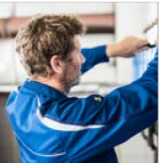
FARBliche AKZENTE KOMPLETTE AUSSTATTUNG