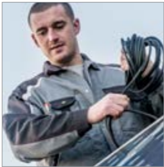
MULTIFUNKTIONS BRUSTTASCHEN KONTRASTKEIL